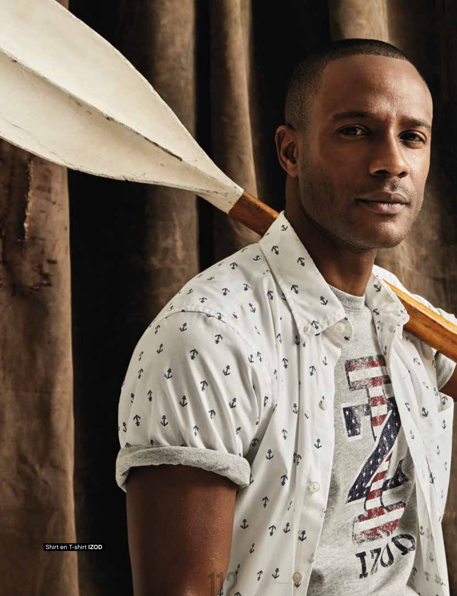
Shirt en T-shirt IZOD