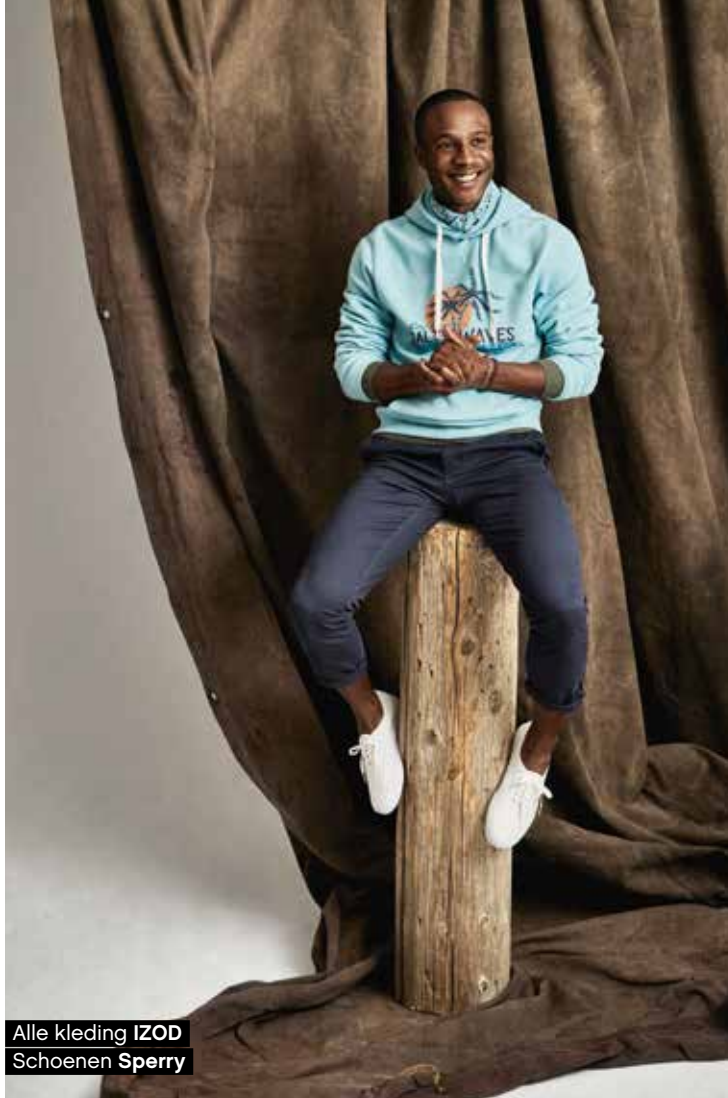
Alle kleding IZOD Schoenen Sperry