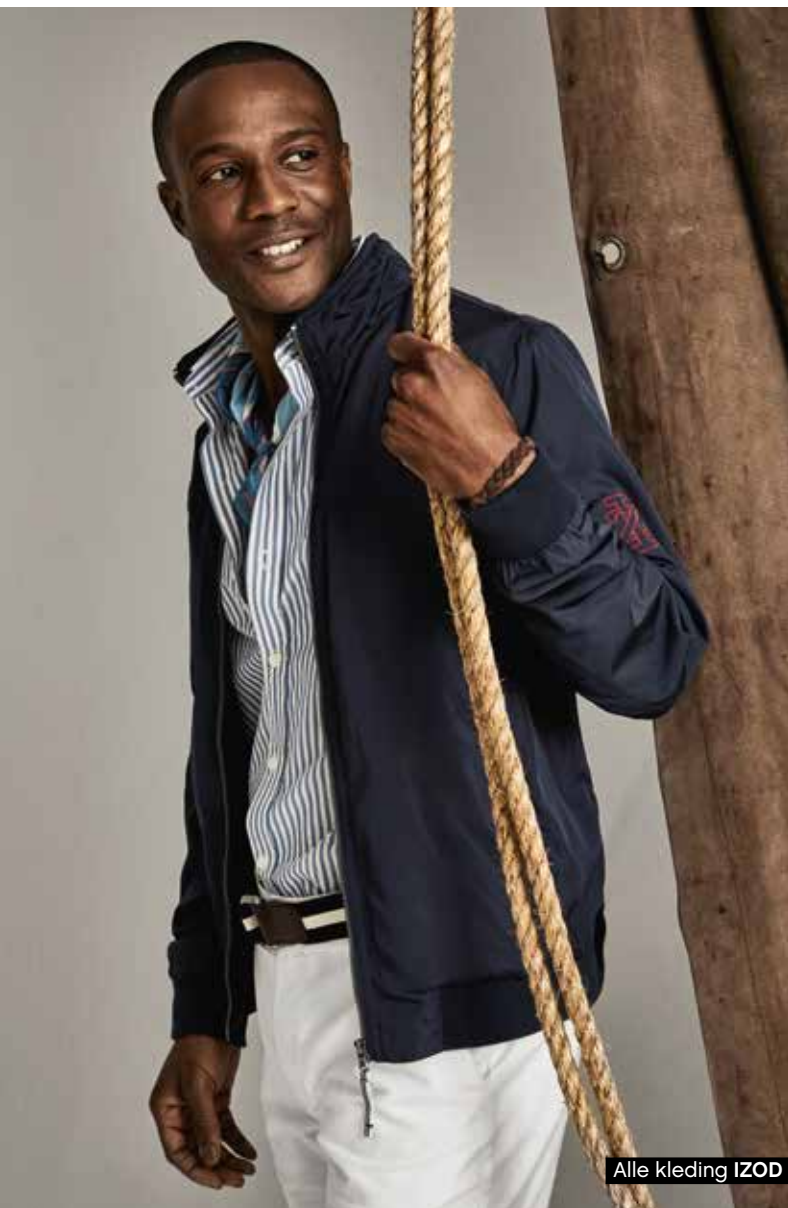
Alle kleding IZOD