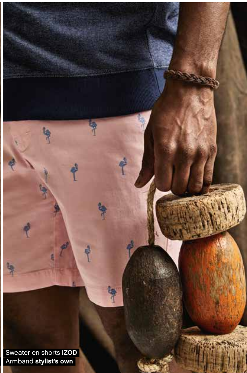
Sweater en shorts IZOD Armband stylist's own