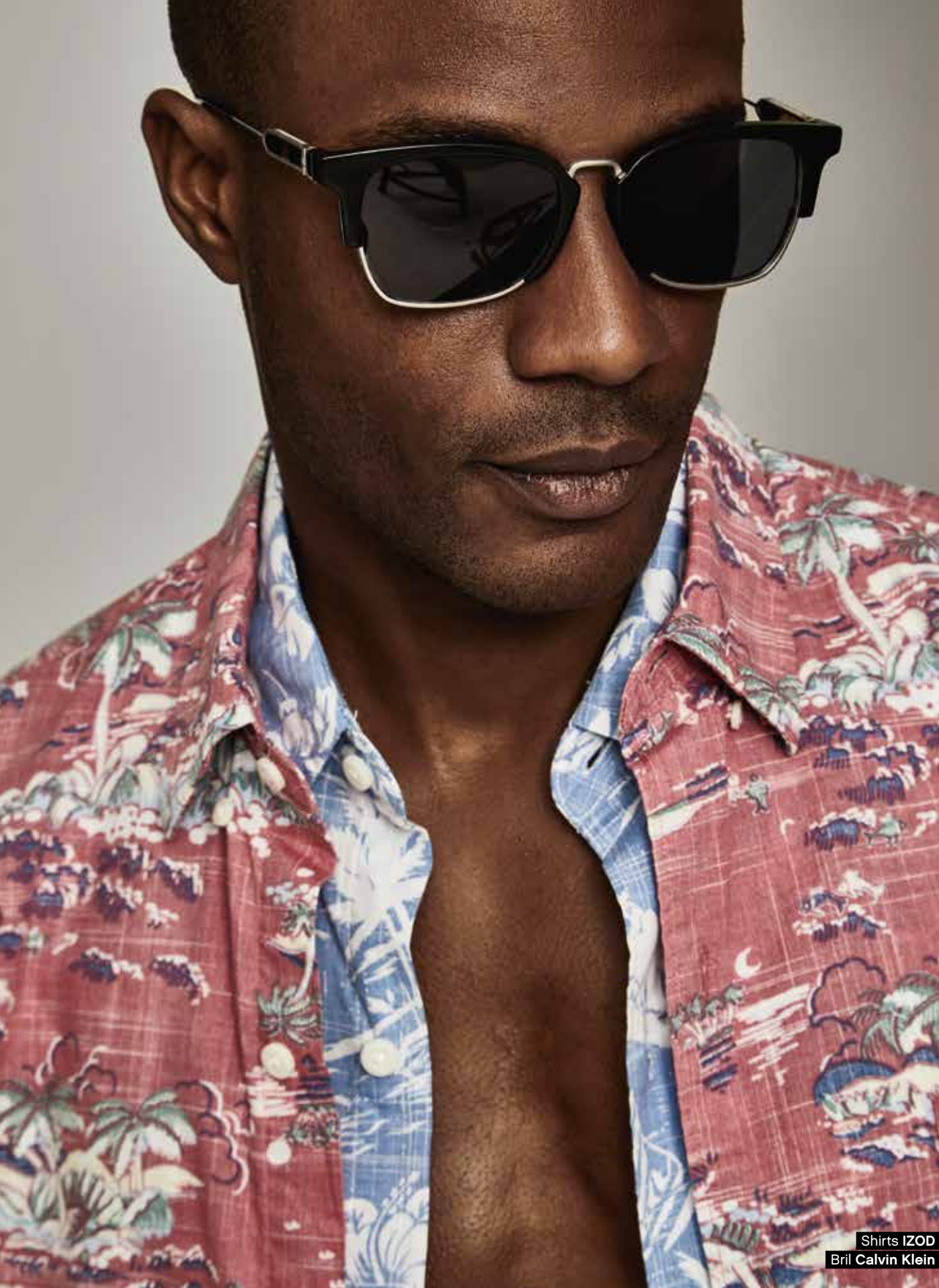
Shirts IZOD Bril Calvin Klein